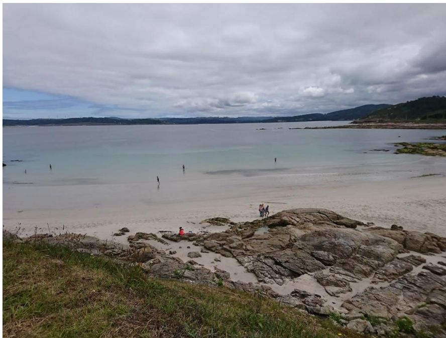
Muxía (Galicia, España), localidad de la Costa da Morte.

Estas dos décadas de aventura personal han aportado un viaje a tierras lejanas que han ayudado a su constante transformación. El inicio se produjo en Gijón y Río de Janeiro en 1999. El impulso con fervor llegó de Buenos Aires, Madrid y Salamanca. La divulgación en medios de comunicación alcanzó su plenitud en Asturias, Málaga y Salamanca. La decisión de organizar el legado se tomó en Barcelona, Lausana y Zúrich. Y la resolución de abordar la recta final, bajando paulatinamente ritmo, tuvo lugar en Muxía y Gijón.