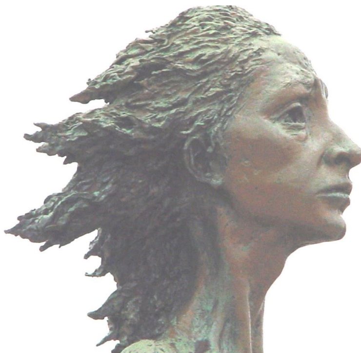
Estatua de la Madre del Emigrante en Gijón (Asturias, España).

Idiomaydeporte.com, la página web que difunde la obra literaria de Jesús Castañón Rodríguez, surgió en una tormenta de creatividad entre marzo y noviembre de 1999 y abrió un espacio, al ser la primera página especializada en el lenguaje deportivo en Internet. Y así, organizó su atención en torno a tres centros de interés: la lengua profesional de los deportistas, las transformaciones que sufre en su difusión social y los cambios que adopta en la literatura sola o en combinación con otras manifestaciones artísticas.