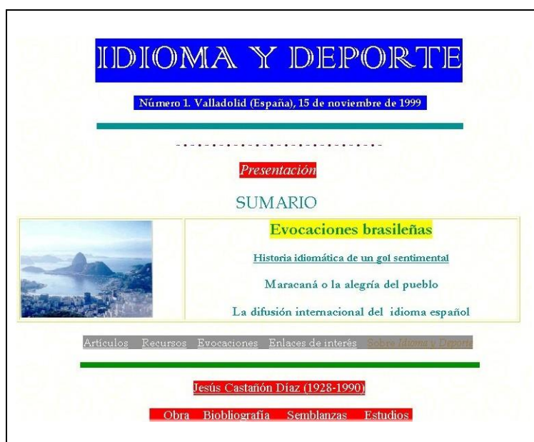
Portada del primer número